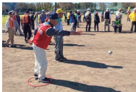
「ナイスプレー」準優勝につながりました

また、その他の競技は惜しくも入賞とはなりませんでしたが、はつらつとプレーされていました。選手の皆さんお疲れ様でした。