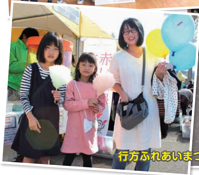
行方ふれあいまつりにおいて