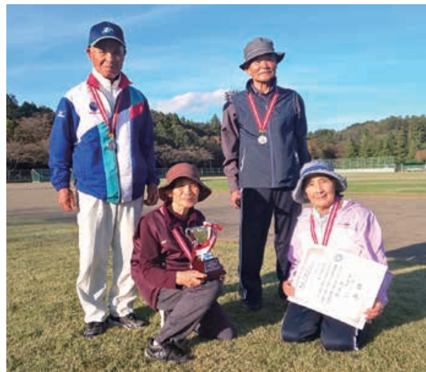
ペタングの部準優勝 永寿会

10月23日(水)那珂総合公園において、第24回茨城県健康福祉祭いばらきねんりんスポーツ大会が開催されました。スポーツを通じて健康の増進を図るとともに、地域間の交流を深め明るく活力ある長寿社会づくりを目的として毎年開催されています。この日は、天気にも恵まれ県内各地より大勢の方々が参加され、行方市からも、クロッケー・ゲートボール・ペタング・輪投げ・グラウンドゴルフの各種目に出場し、日ごろの練習の成果を発揮していました。