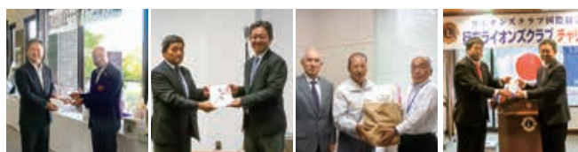
行方ゴルフ連盟 行方市商工会 退公連 ライオンズクラブ