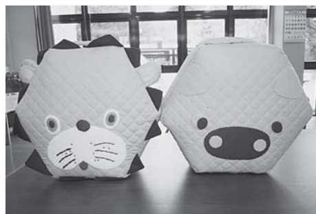
こちらはお子さまにも大人気！