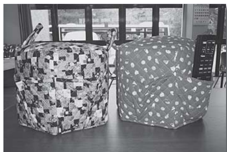
ポケットが2つあります