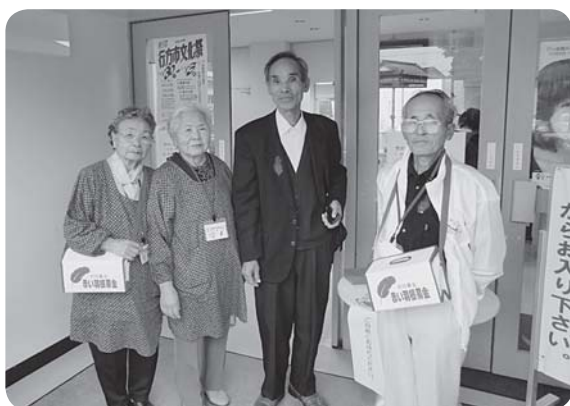
行方市文化祭での募金活動の様子

共同募金運動を実施するにあたり、区長・班長、保育園・幼稚園・小学校・中学校、ボランティアの皆さんを始め、多くの方々のご協力により実施することができました。ご協力いただきまして誠にありがとうございました。