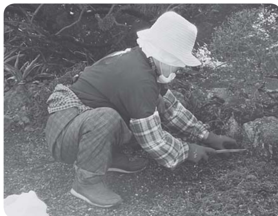
高齢者世帯で除草作業を行いました

事業の取りまとめにおいては、民生委員の皆さんに、また事業実施においては行方市シルバー人材センター会員の皆さんにご協力をいただきました。厚く御礼申し上げます。