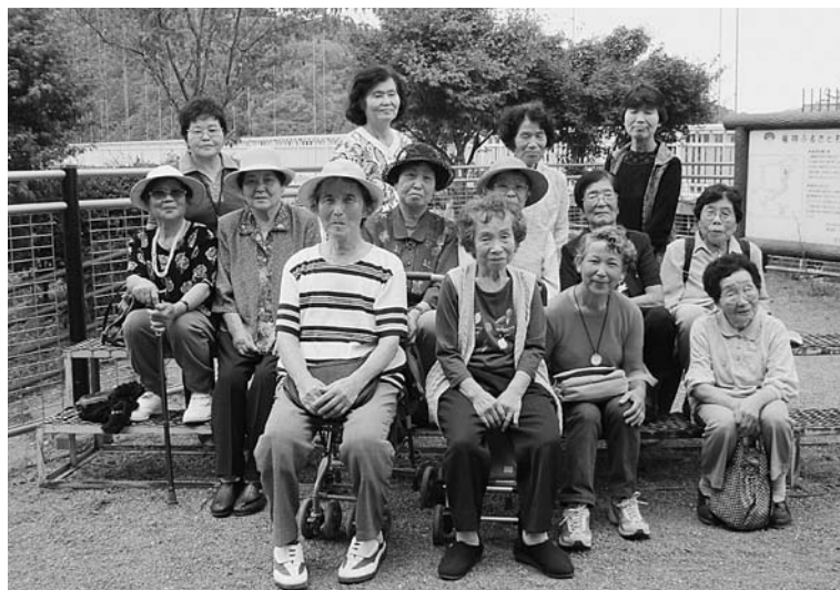
元気で～さ～びす館との合同遠足

このサロンも始まって早20回と回を重ねて参りましたが21回目も簡単体操から物作りなど変わらず月1回の集まりを大切にしていきたいと思っています。