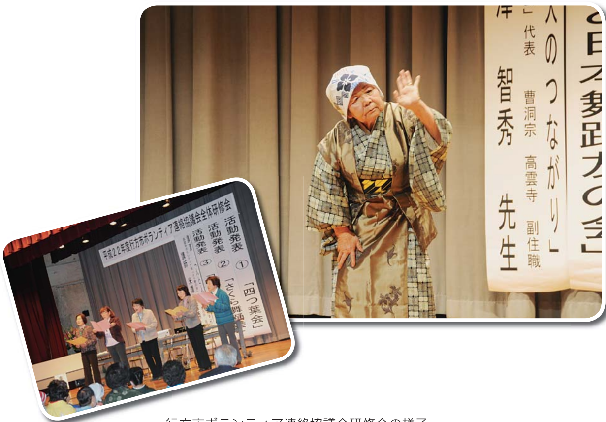
行方市ボランティア連絡協議会研修会の様子 (詳しい内容等、関連記事につきましては、6～7ページに掲載しています)

住所 茨城県行方市玉造甲403番地 ☎ 0299 (36) 2020 FAX 0299 (55) 4545 URL http://www.yokattanet.jp