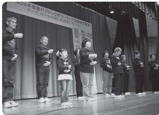
相生会の手話による実践発表

二部の実践発表では、鹿嶋市の「大同西お元気会」と行方市のボランティアグループ「相生会」から日頃の活動内容の紹介があり大変盛況のうちに終わり、活動内容を広く発信する場となり有意義な集会となりました。