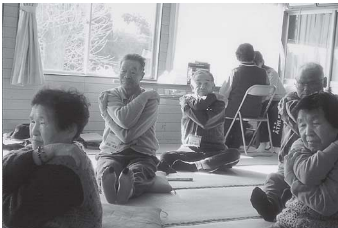
無理をせず、座ったまま体操をしていきます。

今後は、豊かな心と生きる喜びを老人の皆さんと共に元気に過ごしていきたいと思っております。