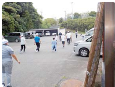
屋外の安全な場所へ避難誘導をし集合、人員確認及び逃げ遅れ者の確認をする。