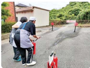
防火管理者による消火訓練を行う。