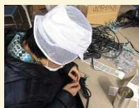
<電機部品組み立て作業>