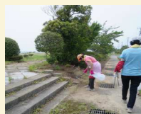
<ふれあいの道清掃>