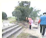
<ふれあいの道清掃>