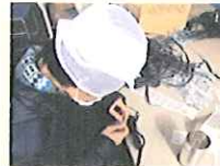
<電機部品組み立て作業>